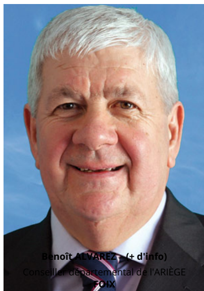
Benoît ALVAREZ - (+ d'info) Conseiller départemental de l'ARIÈGE FOIX